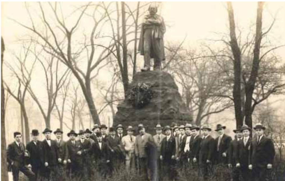
Gruppo in visita alla statua di Garibaldi, il Gran Maestro al centro