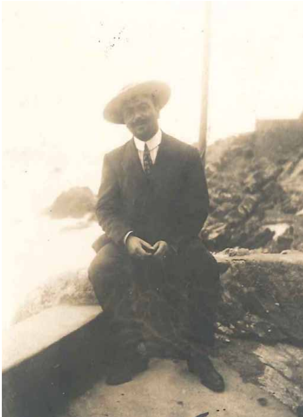
In cravatta e sombrero