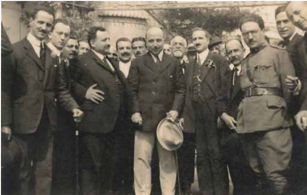
In occasione del simposio del 19 aprile 1920 a Napoli, ritratto con i partecipanti