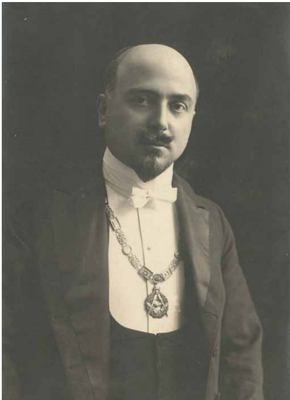
Domizio Torrigiani è eletto Gran Maestro (23 giugno 1919)