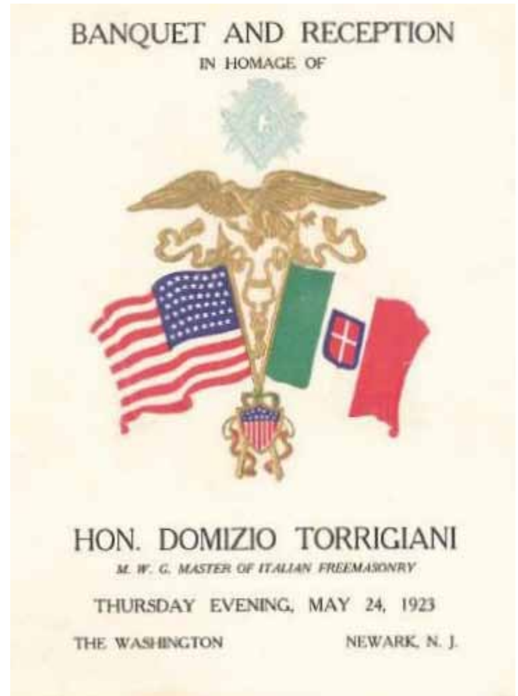
Viaggio negli Stati Uniti, maggio 1923: banchetto in onore del Gran Maestro