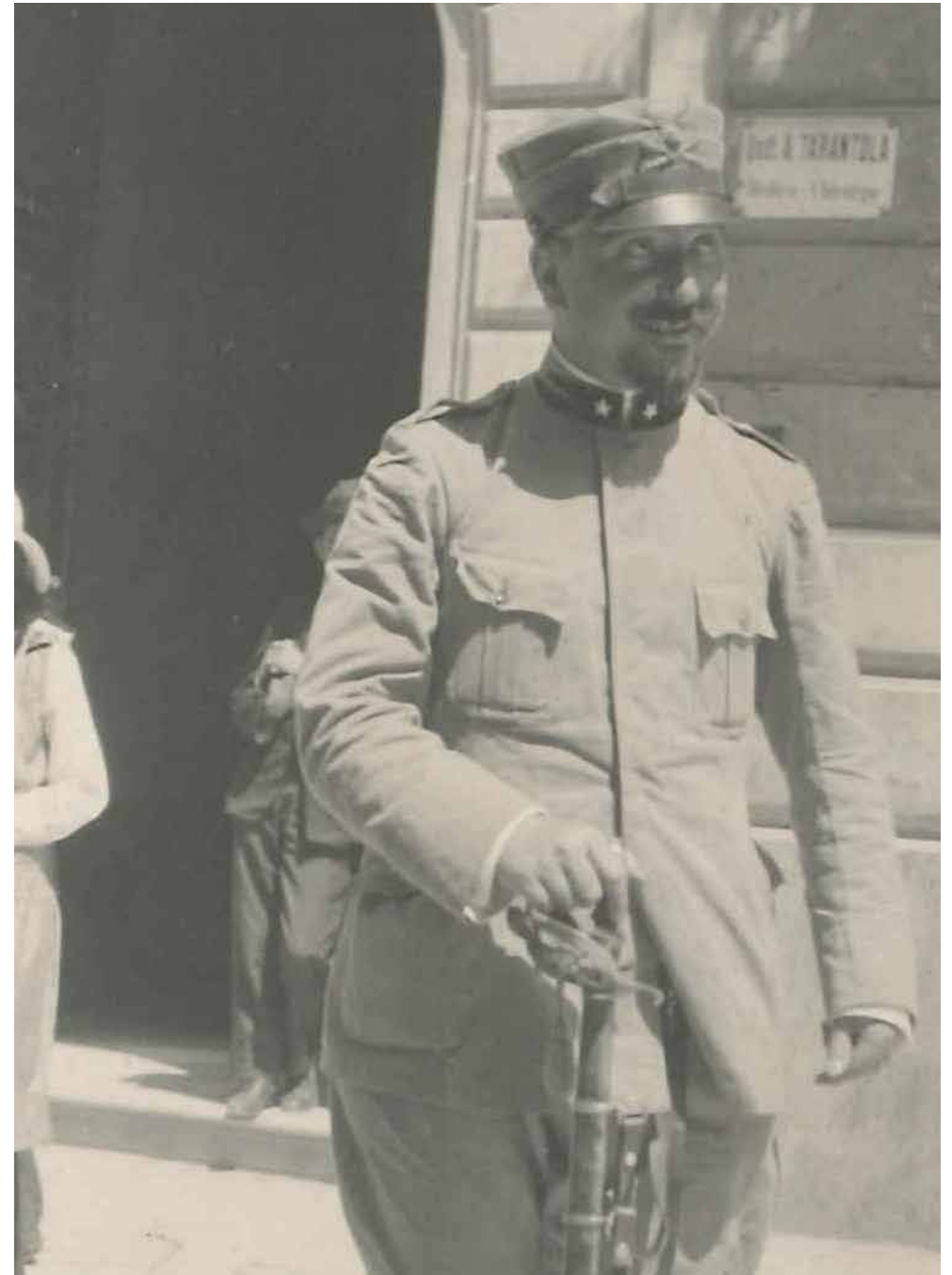
Sorridente, in abiti militari