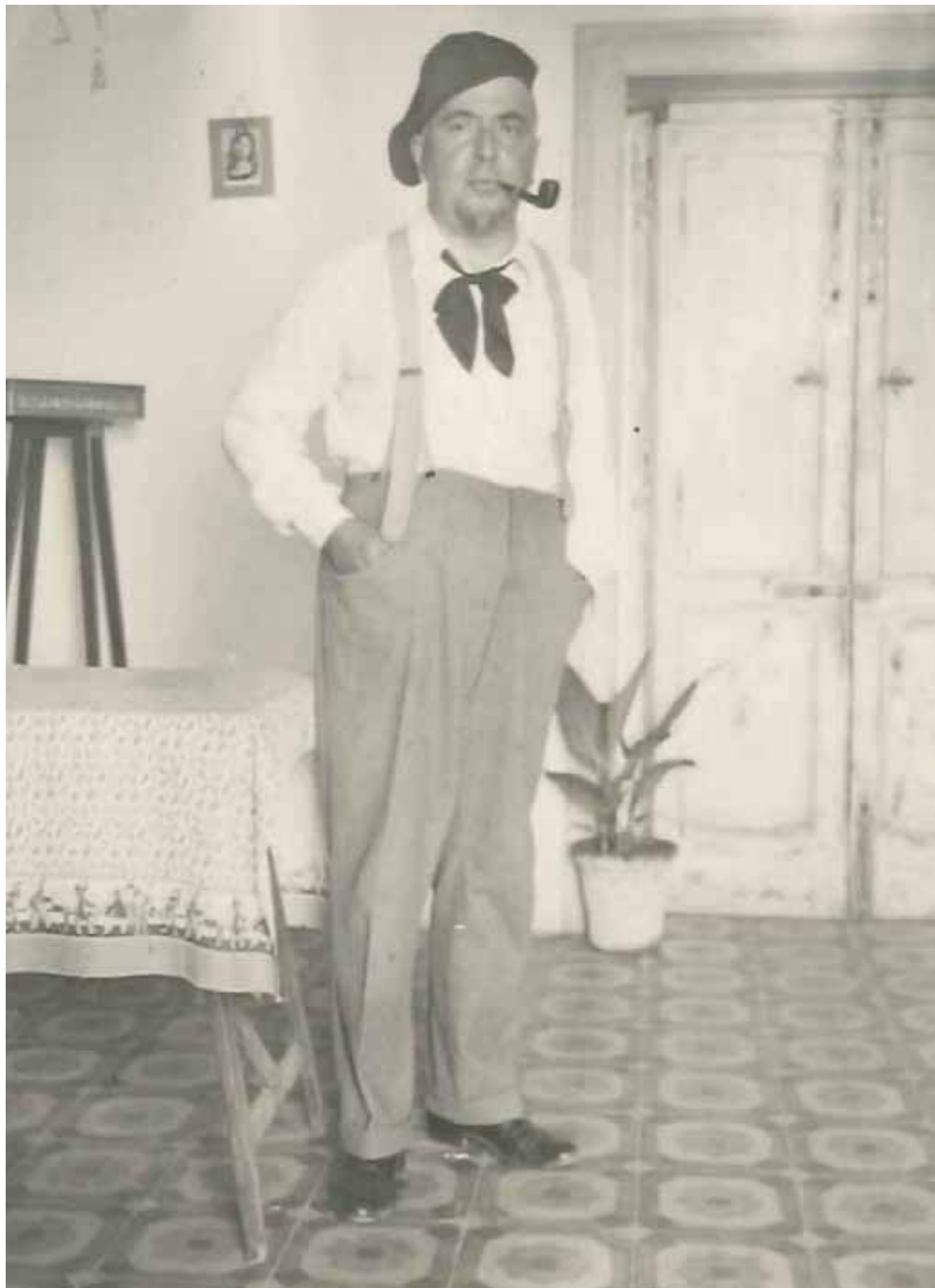
Con berretto e pipa